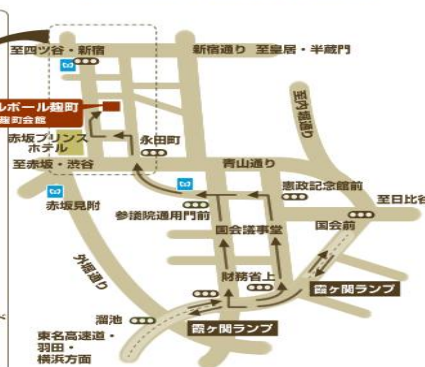
お車でお越しの方